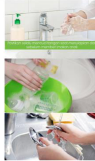
Jaga kebersihan alat makan dan minum untuk anak