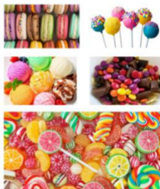
Makanan yang Mengandung Gula Tinggi