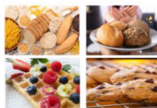
Makanan Mengandung Gluten